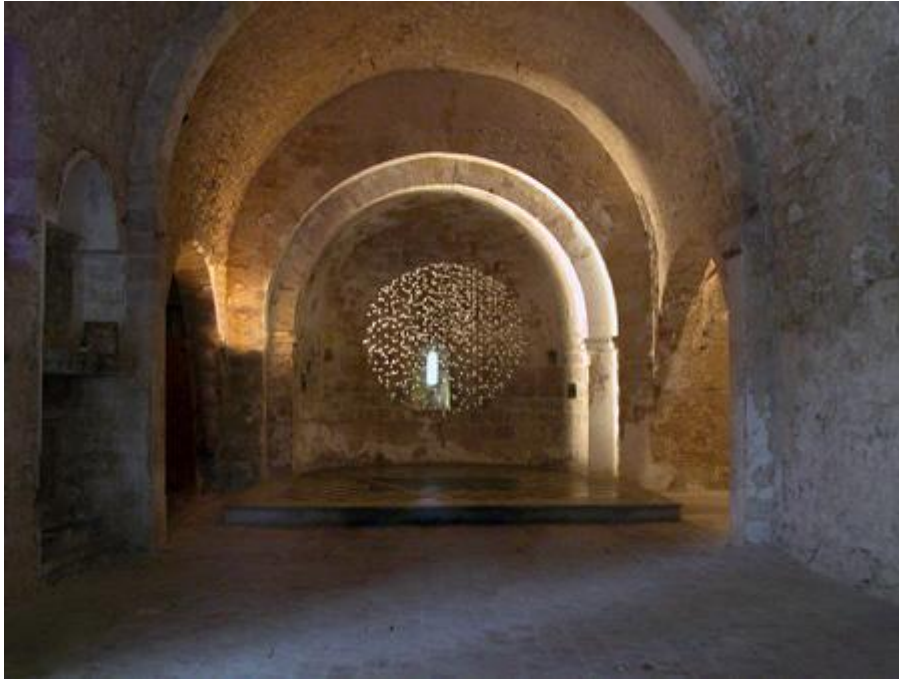
Diamètre 216 -Couvent des Minimes- Pourrières