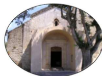
Eglise de Cabrières d'Avignon