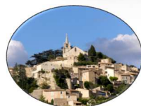
Eglise haute de Bonnieux