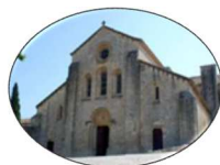
Abbaye de Silvacane La Roque d'Anthéron

Projet supplémentaire lors de cette journée, une courte œuvre pédagogique, La règle du Jeu , du compositeur Karl Naegelen invité par le Festival pour la création, sera travaillée par les amateurs participant au stage. Ces derniers pourront être rejoints par des amateurs de la région sur inscription préalable. Une répétition générale aura lieu en présence du compositeur. L'œuvre, écrite à la fois pour des musiciens professionnels et pour des amateurs, sera interprétée en public au début du concert final de 19h à l'église avec la participation de musiciens du Quatuor Béla.