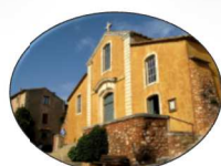
Eglise de Roussillon