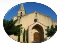
Eglise de Goult