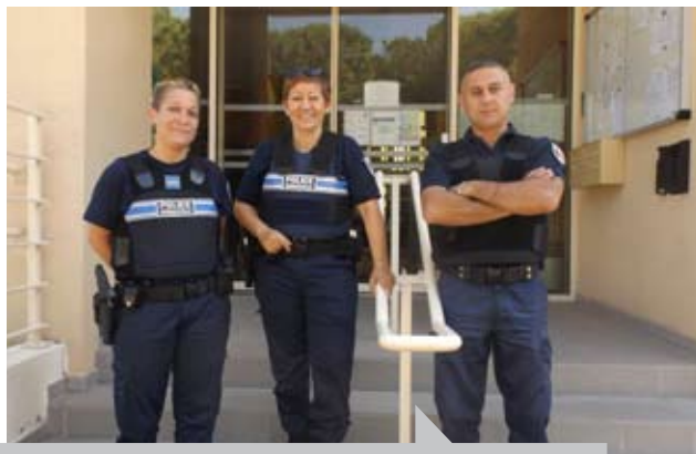
4 Policiers et 2 ASVP assurent votre sécurité sur le village.

Michel Ayme, adjoint au maire, délégué à la Vie quotidienne précise : « La Police municipale et les ASVP sont sollicités dès qu'une manifestation culturelle, sportive ou festive est programmée dans l'espace public, ou simplement pour juguler une forte affluence. Contrôle de sac, barrage filtrant pour limiter la cohue, modification de la circulation en cas d'événement comme lors de la fête du Piano du 10 juin dernier, les policiers municipaux et ASVP sont mis à contribution pour assurer votre tranquillité, au quotidien et également en cette période estivale riche en propositions festives et culturelles. »