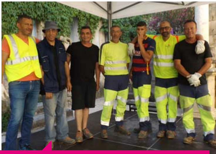
L'équipe Manifestations lors de l'installation des 4 auditoriums de plein air pour l'opération Pianos en fête du 10 juin dernier.

Installer des affiches, des banderoles, monter des estrades, les démonter, assurer les possibilités de branchements électriques, transporter des chaises, des tables, des œuvres, en garantir l'installation conforme, veiller à laisser place nette avant et après les spectacles, être disponible en cas de changement de programme pour tout recommencer... voilà quelques-unes des missions données aux agents des services techniques (service Entretien & Voirie, service Espaces verts, service Manifestations, service Nettoyage) pour permettre la diversité et la multiplicité des propositions municipales mais aussi associatives qui émaillent la vie de notre commune. Merci à tous ces agents pour leur professionnalisme. Veillons ensemble à respecter leur travail : il est indispensable au bon déroulement des projets du village !