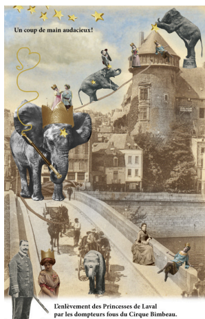
Carte postale belle époque revisitée et détournée.